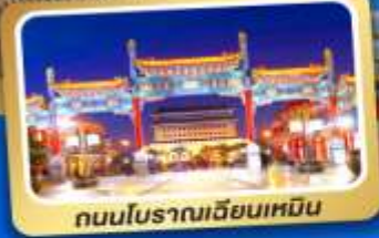
ถนนโบราณเฉียนเหมิน