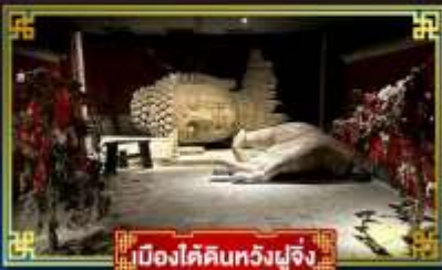
เมืองใต้ดินหวงฝูจิ่ง

“กำแพงหิมะ”...สิ่งมหัศจรรย์ของโลก พระราชวังต้องห้าม อดีตพระราชวังหลวงสุดยิ่งใหญ่