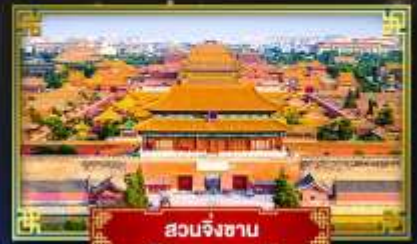
สวนจิงซาน