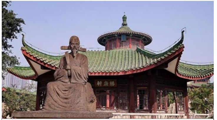
Hairui Tomb

ถึงเมืองไห่โข่ว นำชม สุสานไห่รุ่ย (เป่าบุ๋นจิ้นไห่หล่า) Hairui Tomb 海瑞墓 ไห่รุ่ย (ค.ศ. 1514 ~ ค.ศ. 1587) เจ้าหน้าที่ผู้ซื่อสัตย์และไม่ทุจริต สุสานแห่งนี้สร้างขึ้นครั้งแรกในปี ค.ศ. 1589 ในสมัยราชวงศ์หมิง (ค.ศ. 1368-1644) โครงสร้างบางส่วนในสวนสุสานยังคงสภาพสมบูรณ์ ด้วยพื้นที่กว่า 4,000 ตารางเมตร การจัดวางสุสานได้รับการออกแบบตามระดับของตำแหน่งทางการในสมัยนั้น สถาปัตยกรรมและอาคารในสุสานไห่รุ่ย มีความเคร่งขรึมและดั้งเดิม มีซุ้มประตูหินสูงตระหง่านที่ประตูหน้า มีจารึกแนวอนว่า "ความชอบธรรมของกวางตุ้งตะวันออก (粤东正气)" ทางเดินยาวกว่า 100 เมตร ที่นำไปสู่สุสาน ปูด้วยหินแกรนิต มีการแกะสลักหิน เช่น รูปคนหิน แกะหิน ม้าหิน สิงโตหิน เต่าหินที่ยืนอยู่ทั้งสองข้าง ปัจจุบันสุสานแห่งนี้ได้รับการจัดอันดับให้เป็นมรดกทางวัฒนธรรมที่สำคัญของมณฑลไห่หล่า