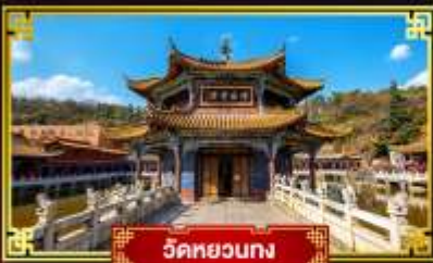
วัดหยวงกวง

นั่งกระเช้าขึ้นสู่อยอดภูเขาหิมะเจี๋ยจื่อ