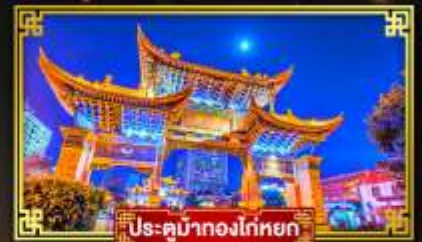
ประตูมาถงใต้หยก