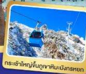
กระเช้าใหญ่ขึ้นภูเขาหิมะมังกรหยก