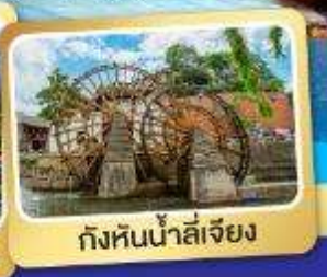
กังหันน้ำลี่เจียง