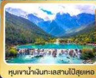
หุบเขาน้ำเงินทะเลสาบโป้สยเหอ