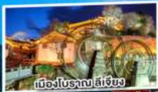
เมืองโบราณ ลี่เจียง

ฟรี ประกันสุขภาพ และอุบัติเหตุ 3 ล้านบาท รวมวงเงิน GTP Plus (Board Plan) คืนของชำรุด