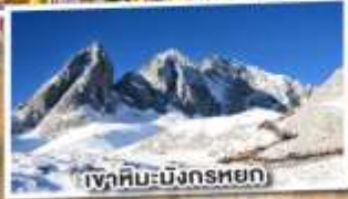
ภูเขาหิมะมิงกรหยก