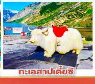
ทะเลสาปเตี้ยซี