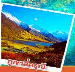
ภูเขาสี่ครุณี