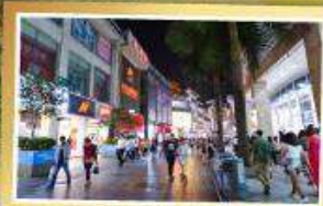
ถนนชุนชี่