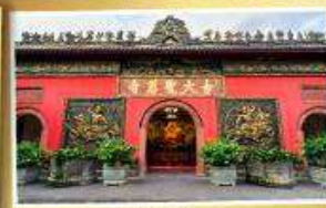
วัดต้าอวี่