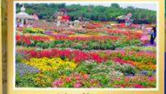
สวนสวรรค์แห่งดอกไม้ Manhuo Manor