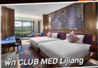
พัก CLUB MED Lijiang