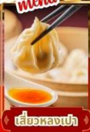
เสี่ยวหลงเป่า