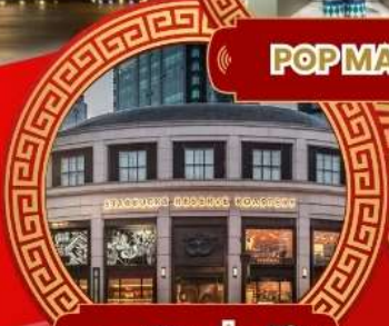
สตาร์บิกเชียงใหม่