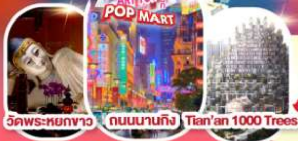
วัดพระหยกขาว ถนนนานกิง Tian'an 1000 Trees