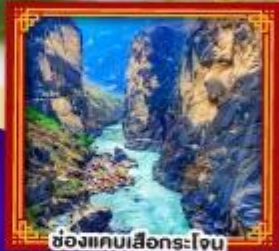
ช่องแคบเสื่อกรโง