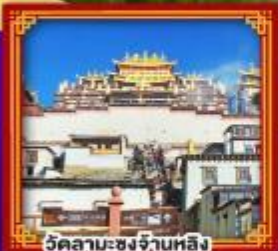
วัดลามะซงจ่าบหลิง