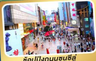
ช้อปปิ้งถนนชุนชี่ลู่