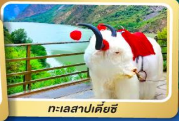
ทะเลสาปเตี้ยซี