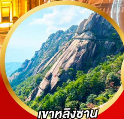
เวาหลิงชาน