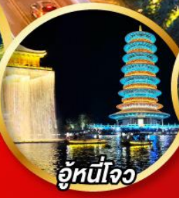
อู่หนี่โจว