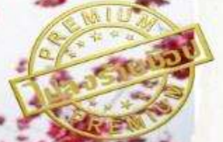
ทุ่งดอกทิวลิป