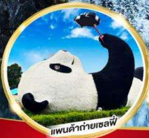
แพนด้ายักษ์เซลฟี่