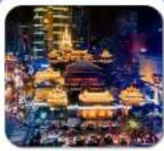
“วัดจิ่งอัน”