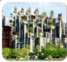
“อาคารพินตันไม้”