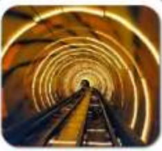
“ลอดอุโมงค์เลเซอร์”

เซี่ยงไฮ้ • ล่องเรือเมืองโบราณจู่เจียเจี้ยว • นั่งรถไฟลอดอุโมงค์เลเซอร์ POP MART • วัดจิ่งอัน • อาคารพินตันไม้ • ตลาดรอยปีเงินหวงเมี่ยว อิสระช้อปปิ้งเต็มวัน หรือ จะซื้อตั๋วเที่ยวดีสนีย์แลนด์