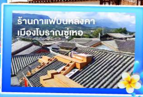
ร้านกาแฟบนหลังคา เมืองโบราณซูเทอ