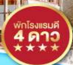
พักโรงแรมดี 4 ดาว