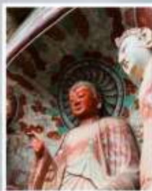
วัดปังหลังชื่อ