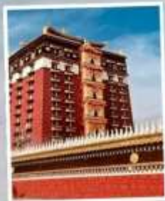
หอเก็บพระไตรปิฎก มิลารเปะ