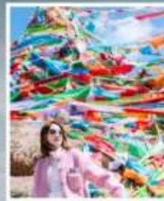
กุเขาสุริยันจันตรา