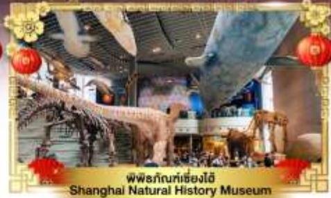
พิพิธภัณฑ์เซี่ยงไฮ้ Shanghai Natural History Museum

เดินทางโดย : สายการบินโซน่าอีสเทิร์นแอร์ไลน์