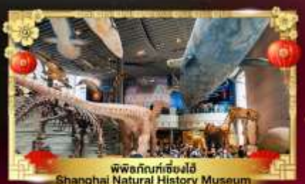
พิพิธภัณฑ์เซี่ยงไฮ้ Shanghai Natural History Museum