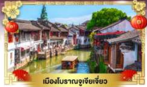
เมืองโบราณจูเจียเจียว