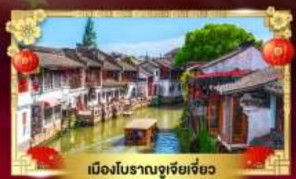
เมืองโบราณซูเจียเจียว

สนุกเต็มพิกัด "สวนสนุกดิสนีย์แลนด์เซี่ยงไฮ้"