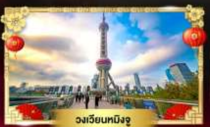
วงเวียนหมิงจู่