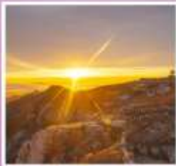
ยอดเขาอวิ้อวาง