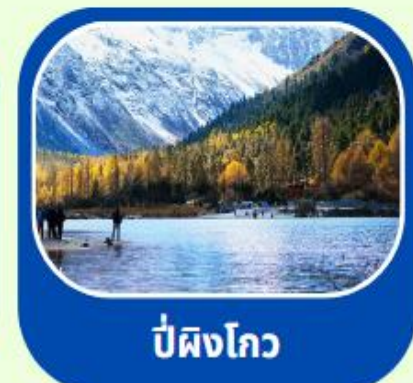
ป่ผิงโกว

เดินทาง : 17-22 พค // 20-25 มิย 8-13 กค 2568