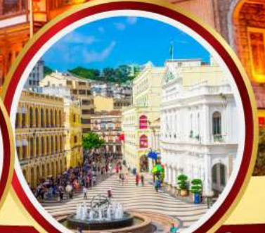
เซนาโดสแควร์