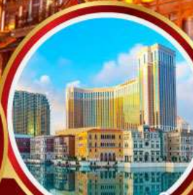
เดอะเวเนเชียน