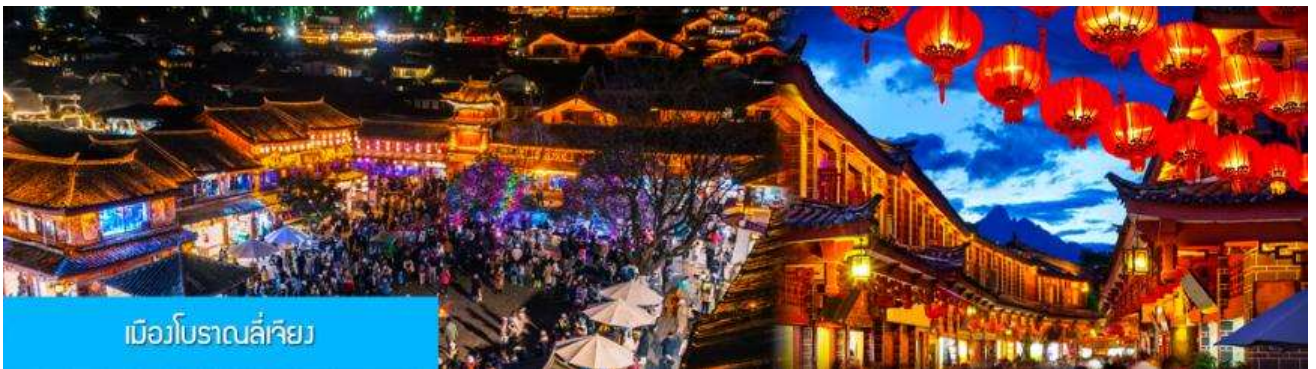
เมืองโบราณลี่เจียง