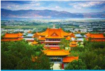
เมืองต้าหลี่