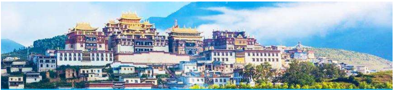
เมืองโบราณเซงกรีล่า