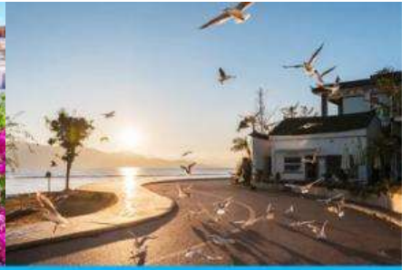
ย่านชายหาดรูป S