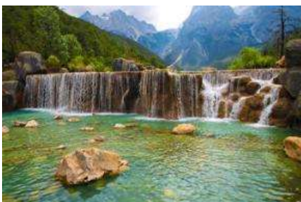
หุบเขาพระจันทร์สีน้ำเงิน "ไปสู่อุทยาน"

เมื่อคณะโดยสารกระเช้าลงจากภูเขาหิมะมังกรหยก