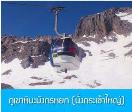
ภูเขาหิมะมังกรหยก (เบ็กระเช้าใหญ่)

พักที่ LIJIANG FENGHUANG HOTEL ระดับ 4 ดาวท้องถิ่นหรือเทียบเท่าในเมืองลี่เจียง