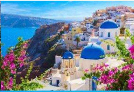
ย่านซานโตรินี่