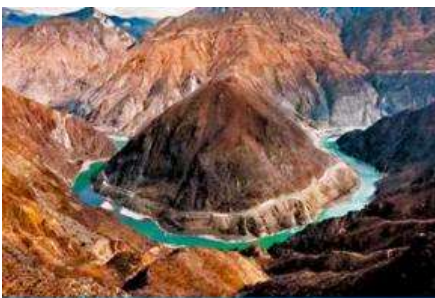
โค้งแรกของแม่น้ำจินชาเจียง

พักที่ PHOENIX HOTEL โรงแรมระดับ 4 ดาวท้องถิ่น หรือเทียบเท่าในเมืองเซงกรีล่า