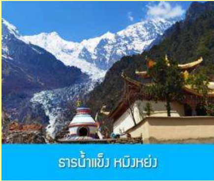
ธารน้ำแข็ง หมิงหย่ง