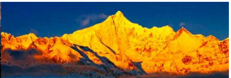
จุดชมวิว 五后山