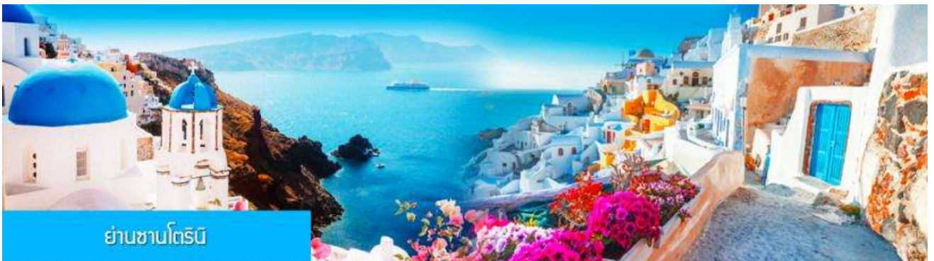
ย่านซานโตรินี่

นำท่านสู่ ย่านซานโตรินี่ 圣托里尼 จุดเช็คอินถ่ายภาพยอดนิยมริมทะเลสาบเอ๋อไห่ เมืองต้าหลี่ นอกจากวิวริมทะเลสาบหลักแล้ว ที่นี่ยังมีร้านกาแฟ(คาร์เฟ่) สไตล์กรีกสุดเก๋ไว้ที่ออกแบบตามคาเฟ่ดังบนเกาะซานโตรินี่ในประเทศกรีซ ตัวร้านกาแฟสร้างอยู่บนเชิงเขาริมทะเลสาบเอ๋อไห่ เป็นจุดชมวิวทะเลสาบและพระอาทิตย์ตกดินที่กลายเป็นจุดเช็คอินยอดฮิตของเมืองต้าหลี่ ( ค่าทัวร์ไม่รวมค่าเครื่องดื่มที่ลูกค้าสั่งทานภายในร้านกาแฟ ทางร้านจะอนุญาตเฉพาะลูกค้าที่สั่งซื้อเครื่องดื่มจากภายในร้านเข้าเช็คอินและถ่ายรูปด้านในร้านกาแฟ)..... จากนั้นนำท่านสู่ ย่านชายหาดรูปอักษร S 洱海 S湾 เป็นอีกโรแมนติคสถานสำหรับคู่รักและนักท่องเที่ยวที่ขี้มอมถ่ายภาพสวย ๆ ที่นี้เป็นถนนสายเรียบชายฝั่งริมทะเลสาบเอ๋อไห่ แนวถนนทอดยาวไปตามแนวชายฝั่งที่เป็นเส้นโค้งคล้ายรูปอักษร S มีร้านอาหารชื่อดังด้วยยอดขายหลายร้อยล้านในเวลาสามปี จนทำให้ที่นี่กลายเป็น