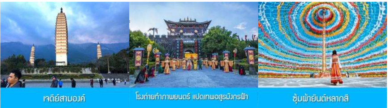
เจดีย์สามองค์

พักที่ DALI ZHUANGYUAN HOTEL โรงแรมระดับ 4 ดาวท้องถิ่น หรือเทียบเท่าในเมืองต้าหลี่