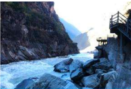
ช่องแคบเสื่อกระโจน

พักที่ DEQING HOTEL ระดับ 4 ดาวท้องถิ่นหรือเทียบเท่าในเมืองเต๋อซิ่น