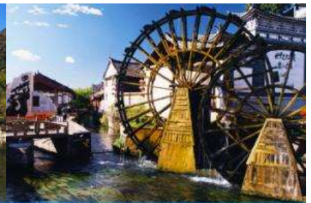
เมืองโบราณลี่เจียง