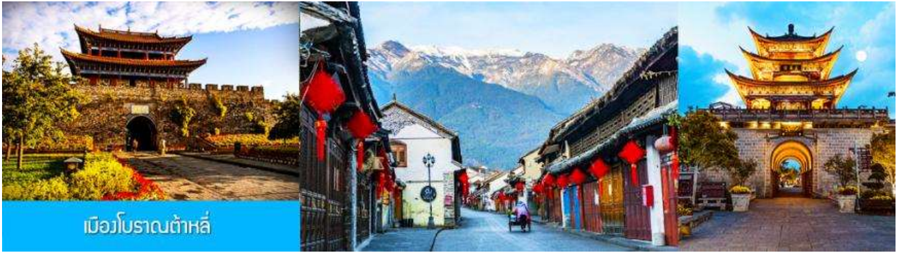
เมืองโบราณต้าหลี่