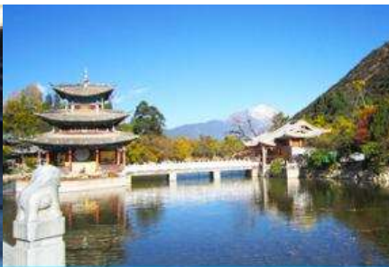
สระน้ำมังกรดำ