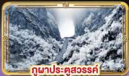
ภูผาประตูสวรรค์