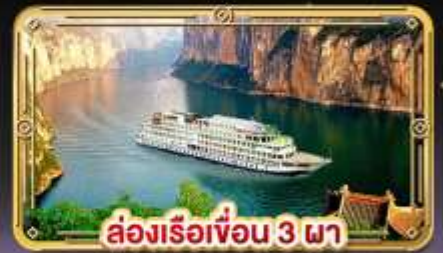
ล่องเรือเขื่อน 3 ภา