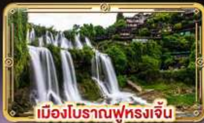
เมืองโบราณฟูหลงเจิ้น