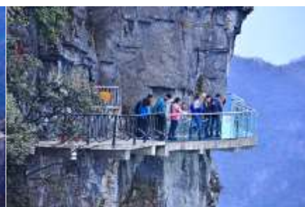
หน้าผาลอยฟ้าทางเดินกระจก