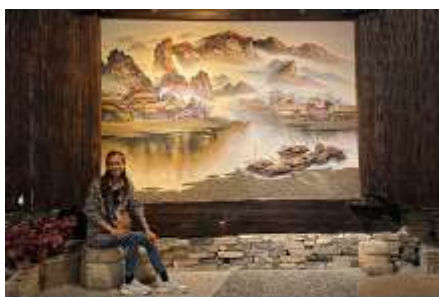
พิพิธภัณฑ์ภาพเขียนหินทราย

พักที่ ZHENMIAN HOTEL OR YINXIANG HOTEL ระดับ 4 ดาวท้องถิ่นหรือเทียบเท่าในเมืองจางเจี๋ยเจี๋ย