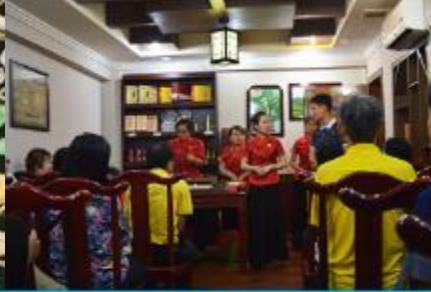
ร้านใบชา