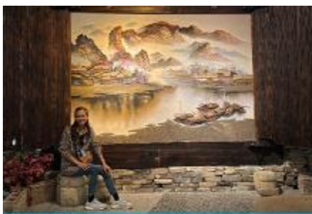
พิพิธภัณฑ์ภาพเขียนหินทราย

พักที่ ZHENMIAN HOTEL OR YINXIANG HOTEL ระดับ 4 ดาวท้องถิ่นหรือเทียบเท่าในเมืองจางเจียเจีย