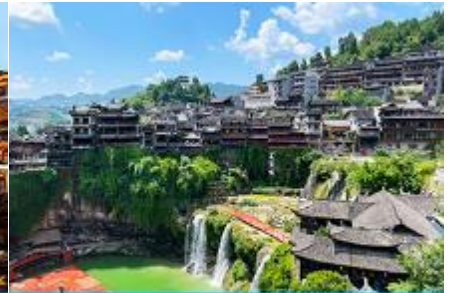
เมืองโบราณผู่หงเจี้ยน