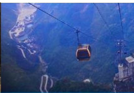
กระเช้าขึ้นเขาเทียนเหมินซาน