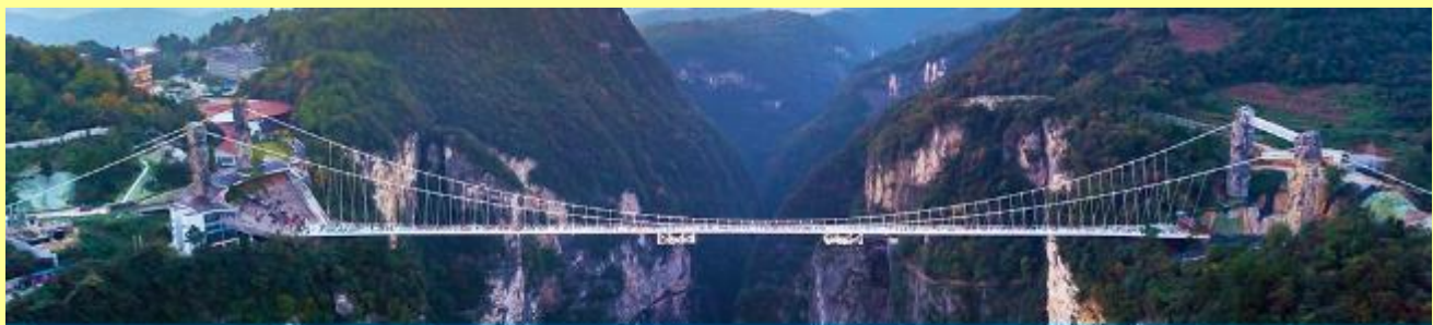
สะพานกระจกข้ามหุบเขาแกรนด์แคนยอน

โปรแกรมเสริมที่ 2 โปรแกรมเที่ยวชมอุทยานภูเขาอวตารแบบครึ่งวันที่รวมค่าขึ้นลิฟท์แก้ว (ผู้เข้าร่วมขั้นต่ำ 15 ท่าน) ใช้เวลาประมาณ 4-6 ชั่วโมง (ขึ้นอยู่กับจำนวนนักท่องเที่ยวในแต่ละวัน) อัตราค่าบริการท่านละ 750 หยวนหรือ 3,750 บาท นำท่านเที่ยวชมจุดชมวิวลำธารจินเปียนซีที่สามารถมองเห็นวิวยอดเขาอวตารได้ชัดเจน นำท่านเที่ยวชมจุดชมวิวมณฑลฉางชาจินเปียนซีที่สามารถมองเห็นวิวยอดเขาอวตารได้ชัดเจน นำท่านขึ้นลิฟท์แก้วแล้วไปหลงที่สามารถมองเห็นทัศนียภาพของภูเขาอวตารและลิฟท์แก้วได้ชัดเจน นำท่านขึ้นลิฟท์แก้วขึ้นสู่ยอดเขาอวตาร นำท่านเดินชมจุดชมวิวด่าง ๆ บนยอดเขาอวตารได้แก่ภูเขาเสาเสวยราชย์ สะพานหนึ่งในใต้หล้า... อัตราค่าบริการรวม ค่าบัตรเข้าอุทยาน ค่ารถรับส่งภายในเขตอุทยาน ค่านำเที่ยวของไกด์ท้องถิ่น