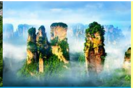
ภูเขาอวตาร

โปรแกรมเสริมที่ 2 โปรแกรมเที่ยวชมอุทยานภูเขาอวตารแบบครึ่งวันที่รวมค่าขึ้นลิฟท์แก้ว (ผู้เข้าร่วมขั้นต่ำ 15 ท่าน) ใช้เวลาประมาณ 4-6 ชั่วโมง (ขึ้นอยู่กับจำนวนนักท่องเที่ยวในแต่ละวัน) อัตราค่าบริการท่านละ 750 หยวนหรือ 3,750 บาท นำท่านเที่ยวชมจุดชมวิวลำธารจินเปียนซีที่สามารถมองเห็นวิวยอดเขาอวตารได้ชัดเจน นำท่านเที่ยวชมจุดชมวิวมณฑลฉางชาจินเปียนซีที่สามารถมองเห็นวิวยอดเขาอวตารได้ชัดเจน นำท่านขึ้นลิฟท์แก้วแล้วไปหลงที่สามารถมองเห็นทัศนียภาพของภูเขาอวตารและลิฟท์แก้วได้ชัดเจน นำท่านขึ้นลิฟท์แก้วขึ้นสู่ยอดเขาอวตาร นำท่านเดินชมจุดชมวิวด่าง ๆ บนยอดเขาอวตารได้แก่ภูเขาเสาเสวยราชย์ สะพานหนึ่งในใต้หล้า... อัตราค่าบริการรวม ค่าบัตรเข้าอุทยาน ค่ารถรับส่งภายในเขตอุทยาน ค่านำเที่ยวของไกด์ท้องถิ่น