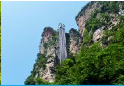
ลิฟท์แก้วไปหลม