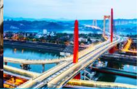
เมืองหยี่ชาง

วันที่ห้า เมืองจางเจี๋ยเจี๋ย- เลือกซื้อโปรแกรมทัวร์เสริม OPTIONAL TOUR - ร้านหยก-ร้านใบชา-เมืองหยี่ชาง