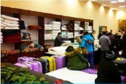
ศูนย์จำหน่ายผลิตภัณฑ์ยางพารา

พักที่ ZHENMIAN HOTEL OR YINXIANG HOTEL ระดับ 4 ดาวท้องถิ่นหรือเทียบเท่าในเมืองจางเจียเจี๋ย