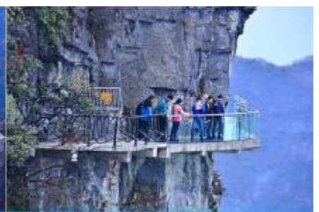
หน้าผาลอยฟ้าทางเดินกระจก