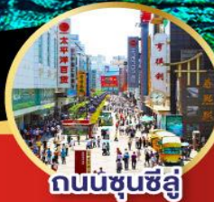
ถนนชุนชี่ลู่