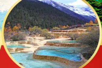
อุทยานหลวงหลง

05 – 10 ก.ย.67 28,900 06 – 11 ก.ย.67 28,900 07 – 12 ก.ย.67 28,900 12 – 17 ก.ย.67 28,900 13 – 18 ก.ย.67 28,900 14 – 19 ก.ย.67 28,900 19 – 24 ก.ย.67 28,900 21 – 26 ก.ย.67 28,900