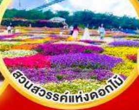
สวนสวรรค์แห่งดอกไม้