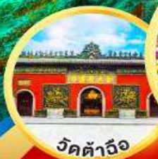
วัดต้าจื่อ