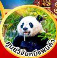
ศูนย์วิจัยหมีแพนด้า