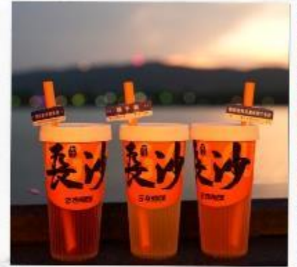
เซียงเจียงริเวอร์ไซด์