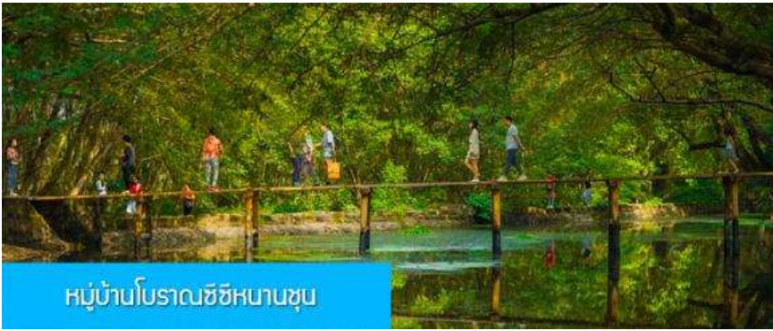
หมู่บ้านโบราณซีซีหนานซุน