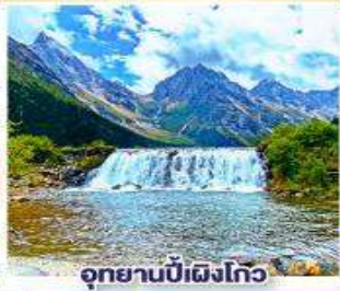
อุทยานบีฝิงโกว