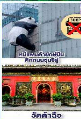
หมีแพนด้ายักษ์ปิ่น ตึกถนนชุนซีลู่