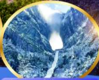
ประตูล่องเรือ เขียนหมื่นชาน