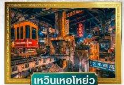
เหวินเหอหยั่ว