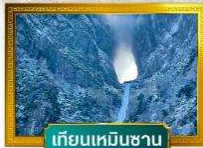
เทียนเหมินซาน