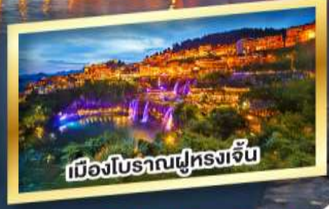
เมืองโบราณฟูหลงเจิน