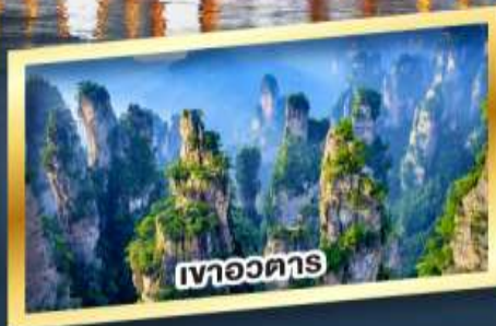
เขาอวดาร