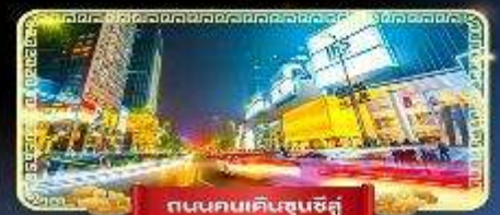
ถนนคนเดินชุนชิว