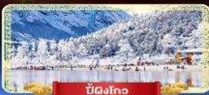
ปี้ดิงโกว

สัมปัสสวรรค์บนดินแห่งเมืองจีน เที่ยวสุดคุ้ม 3 อุทยานทางธรรมชาติ