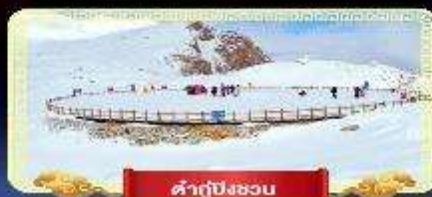
คำกู่ปิงชอน