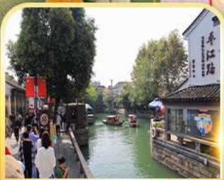
ท่องเที่ยวโบราณผิงเจียง