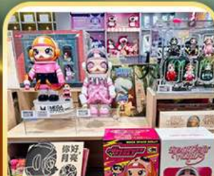
Popmart หังหุปิ่น อิน77