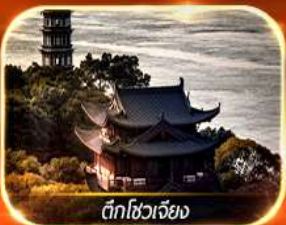
ตึกโซเวเจียง