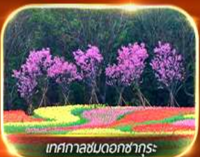
เทศกาลชมดอกซากุระ

ตระการตาหุบเขาเทวดาวังเซียนกุ๋ เช็คอินที่เก๋วใหม่ นั่งรถไฟรมพาคันแรกของโลก สัมผัสบรรยากาศเมืองโบราณท้องถิ่น