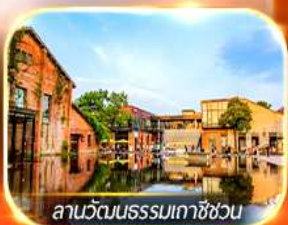
ลานวัฒนธรรมเกาซัง