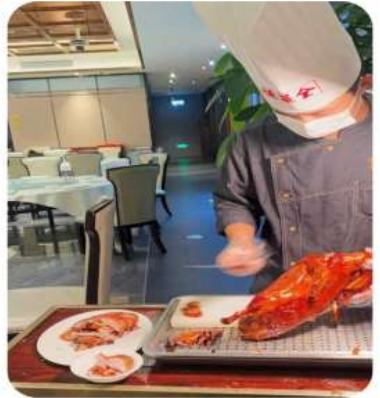
เมนูพิเศษ เปิดปีกกิ้ง

จากนั้นนำท่านเที่ยวชม ถนนโบราณความจำย แปลเป็นไทยได้ใจความ "ซอยกว้างซอยแคบ" เหมือนพาท่านย้อนกลับไปสู่เมืองจินโบราณแต่ผสมผสานกับความทันสมัยเข้าไปได้อย่างลงตัว ถนนคนเดินมี 3 ซอย แต่ละซอยมีความยาวประมาณ 400 เมตร มีร้านค้าเล็กๆ ตั้งเรียงรายอยู่ในแต่ละซอยและตรอกให้เดินช้อปปิ้งกันเพลิน ให้ท่านได้เลือกซื้อ