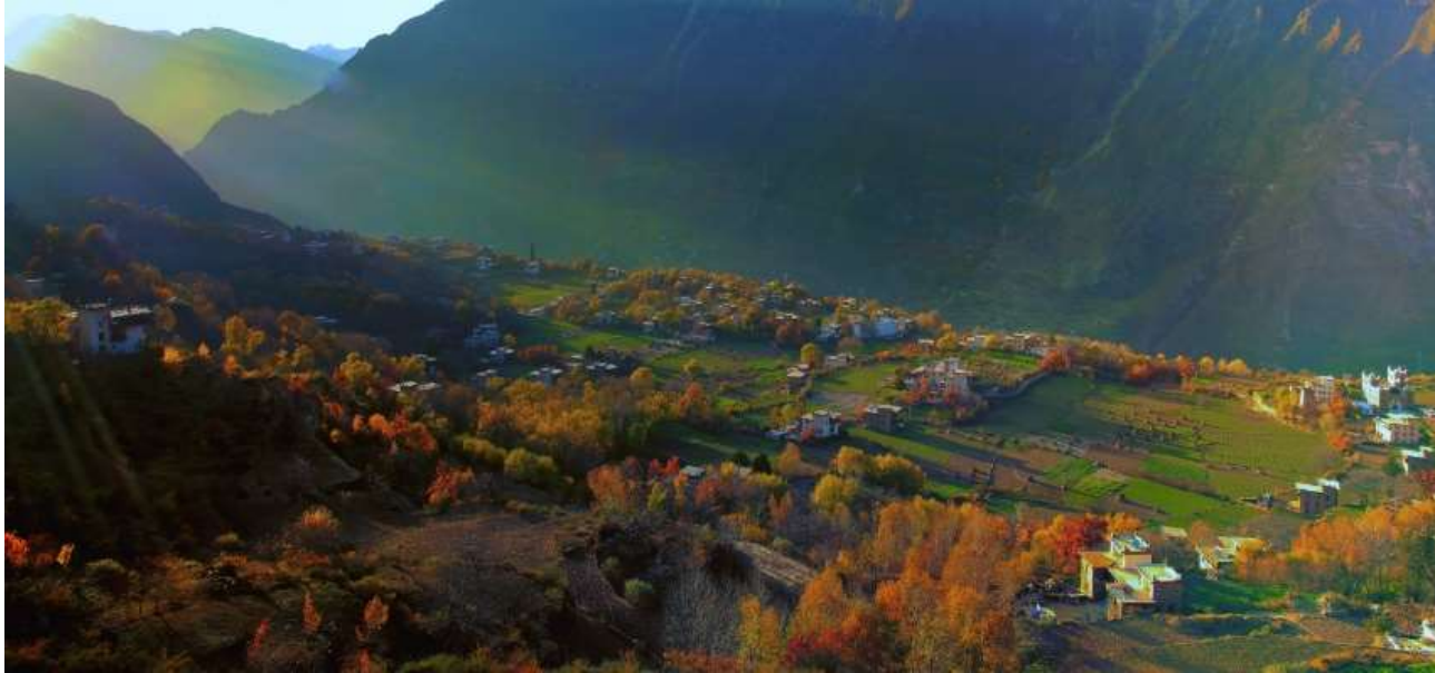
Photo shows the picturesque autumn scenery of Danba county, southwest China's Sichuan Province.

นำท่านนั่งรถของอุทยาน เข้าสู่ ซวงเฉียวโกว หรือ หุบเขาสะพานคู่ มีระยะทาง 34.8 กม. มีพื้นที่รวม 216 ตารางกิโลเมตร จุดท่องเที่ยวแบ่งออกเป็น 3 ส่วน ส่วนแรก หุบเขาหินหยาง หุ่นต้นหยาง แล้วเดินทางเข้าสู่ส่วน ลึกสุดท่านจะได้เห็นธารน้ำแข็ง ภูเขากระจกแก้ว ภูเขาดวงอาทิตย์ ภูเขาดวงจันทร์ ยอดเขากระต่าย ส่วนกลาง นำท่านย้อนกลับมาชมทะเลสาบ ส่วนที่สาม นำท่านชมทุ่งหญ้าเหนียนหยูป่า ชมยอดเขารูปร่างแปลกตา เช่น ยอดเขาพราน ยอดวังโปตาลา ยอดเขาเพชร ภูเขาหญิงตั้งครรภ์ ถ่ายรูปกันอย่างจุใจกับท้องทุ่งกว้างที่มีฉากหลัง เป็นภูเขาสูงปกคลุมด้วยหิมะขาว ในหุบเขาจะมีลำธารใสสะอาด และสนสูงสีเขียวเข้มสลับด้วยต้นไม้หลายหลาก เฉดสี เช่น เขียวอ่อน เขียวแก่ เหลืองส้ม แดง น้ำตาลเข้ม เนื่องจากอยู่ในฤดูกาลใบไม้เปลี่ยนสี