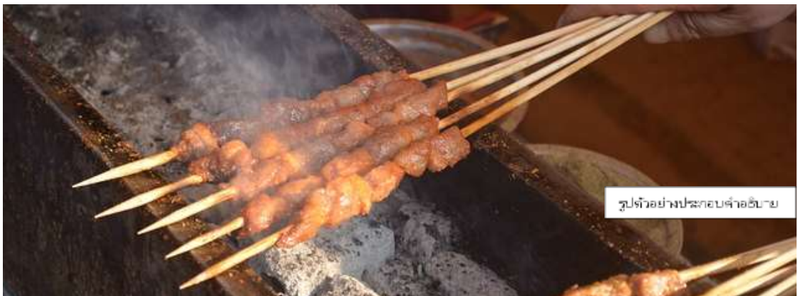
รูปตัวอย่างประกอบคำอธิบาย

เพิ่มพิเศษ เมนูหมูปิ้งย่างหมาล่า ท่านละ 5 ไม้เล็ก