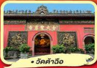
วัดต้าเอี๊ยะ