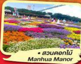
สวนดอกไม้ Manhua Manor

ไม่ลงร้านช้อปปิ้ง พักโรงแรม 4-5 ดาว ชมโชว์ริเบต โชว์เปลี่ยนหน้ากาก