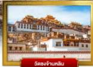
วัดชงจี้หลิน