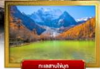
ทะเลสาบโง่กู่