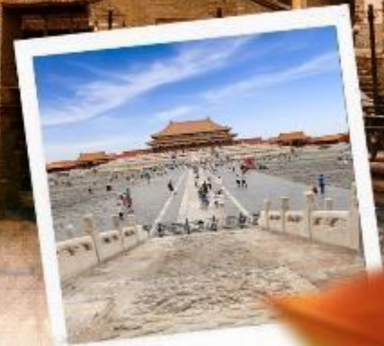
พระราชวังกู่กง