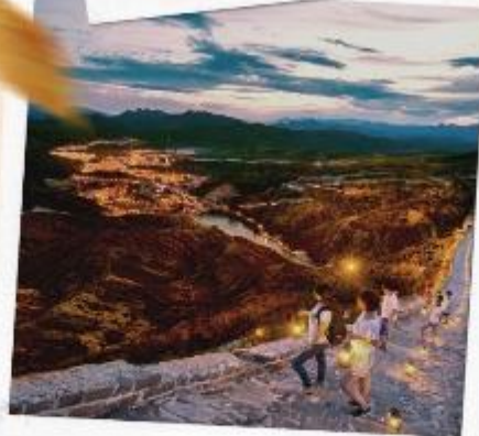
กำแพงเมืองจีนซื่อหม่าโถ