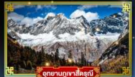
อุทยานภูเขาสี่ฤดู