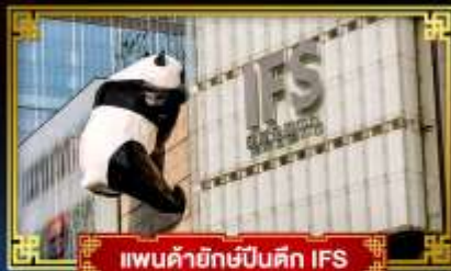
แพนด้ายักษ์ปิงตึก IFS