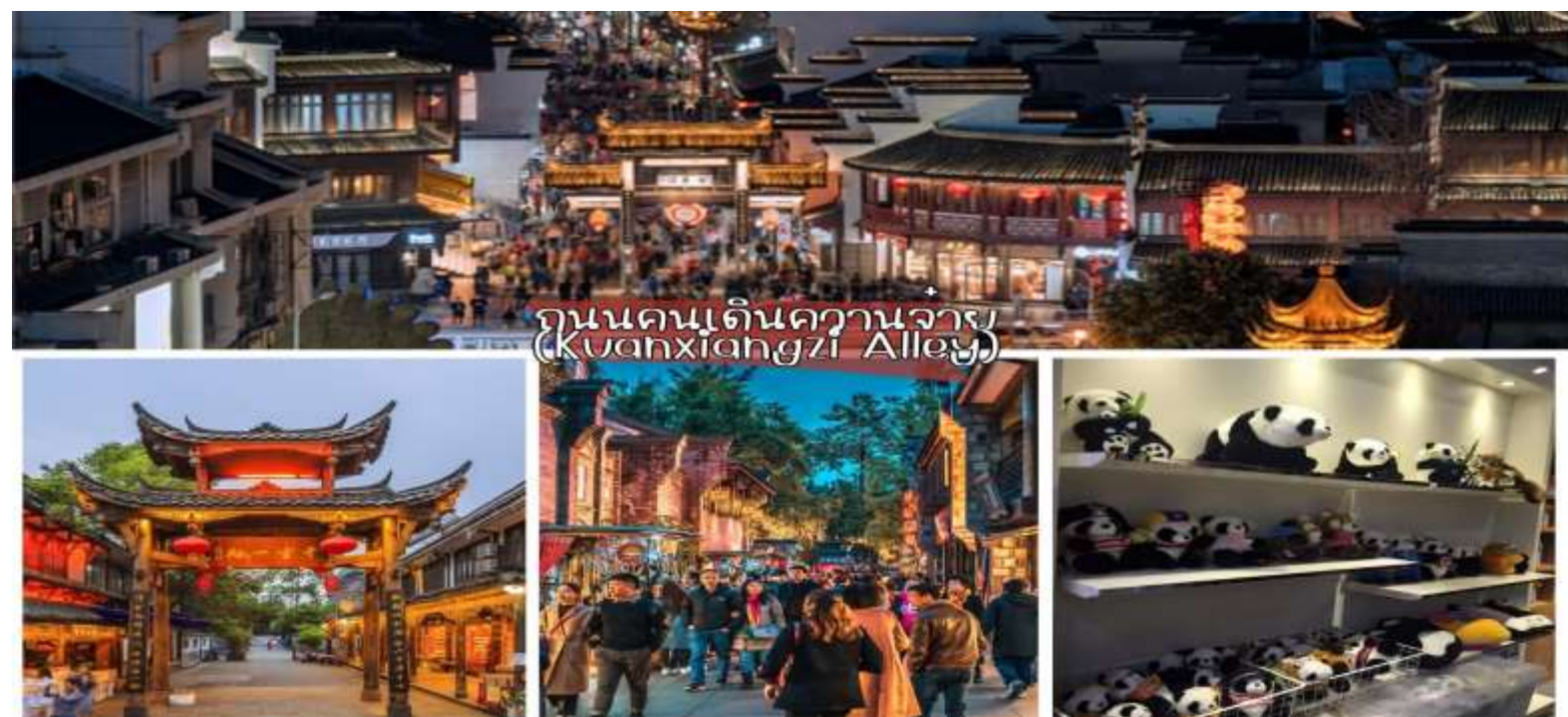
ถนนคนเดินความจำ (Kuanxiangzi Alley)

เช้า รับประทานอาหารเช้า ณ โรงแรมที่พัก นำท่านเดินทางจากก๊วยหยาง สู่สถานีรถไฟเฉิงตู เพื่อโดยสารรถไฟความเร็วสูงหัวจรวด G5392- : 09.07-12.38 น. (เวลาอาจมีการเปลี่ยนแปลงตามความเหมาะสม) เที่ยง รับประทานอาหารกลางวันบนรถไฟ แบบเข้าวอล์กเกอร์ หรือ บริการชุด KFC บ่าย นำท่านไปยัง ซอยความจำ แปลว่า "ซอยกว้าง-ซอยแคบ" ซอยความจำถือเป็นถนนอนุรักษที่มีสีสันที่สุดของเมืองเฉิงตู มีของให้เลือกชมทั้งของกิน เนื้อแพะย่างเสียบไม้ ไอศกรีม น้ำผลไม้ หมูสามชั้น รมควันชิ้นแบบแพค นำมาต้มผักรวมได้ต้องแบ่งใช้เนื่องด้วยจะมีรสชาติเค็ม น้ำพริกถั่วเขียว สำหรับนำมาผัดผัก ผลไม้ชิ้นชื่อต่างๆ ของมณฑลเสฉวน รวมถึงสินค้าของที่ระลึกต่างๆ ซึ่งมีทั้งหิน เครื่องประดับต่างๆ, หรือสิ่งของที่เป็นเอกลักษณ์โดดเด่นของประเทศจีน อาทิ น้ำเต้าที่ระลึก หรือ ภาพวาดจีน ผ้าพันคอ ตุ๊กตาพวงกุญแจหมีแพนด้า ตุ๊กตาหมีแพนด้า ฯลฯ