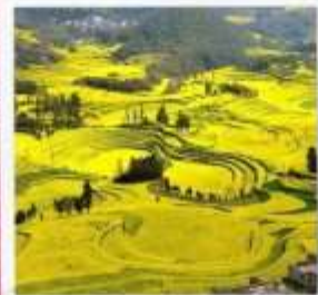
จุดชมวิวกุเขาไก่ทอง