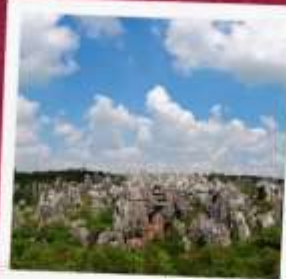
อุทยานป่าหิน