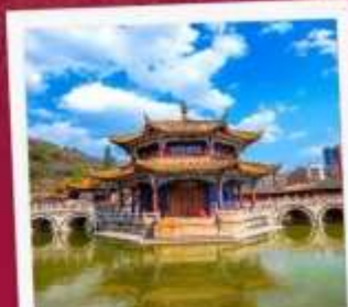
วัดหยวนทอง