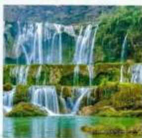
น้ำตกเก้ามังกร