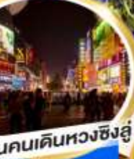
ถนนคนเดินหวงซิงฮู