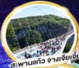
สะพานแก้ว จางเจียเจีย