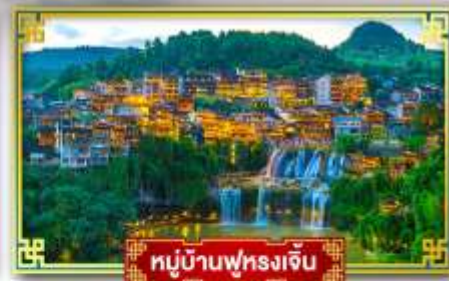
หมู่บ้านฟุรงเจิน