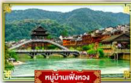
หมู่บ้านเฟิ่งหวง