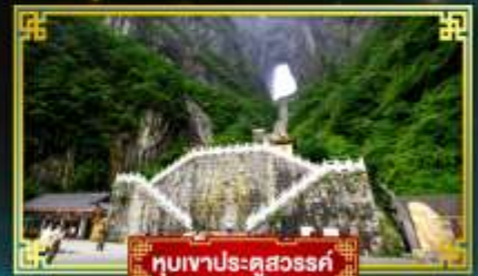
ทิวเขาประตูสวรรค์