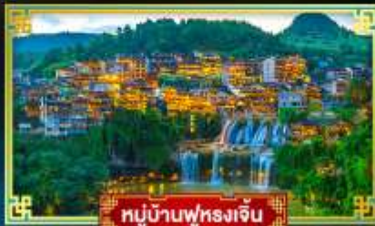
หมู่บ้านฟุรงเจิน