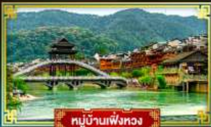
หมู่บ้านเฟิ่งหวง

ขุนเขามรดกโลกกลางผาหนอก "ฟ่านจิ้งชาน" ท่องสูดดินแดนแห่งภาพวาดจางเจียเจีย