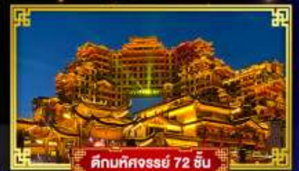
ตึกทศวรรษ 72 ชั้น